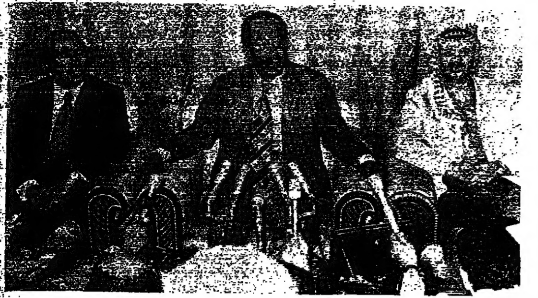
الرئيس السادات والسيدان ياسر عرفات واسماعيل فهمي وزير الخارجية المصري أثناء المؤتمر الصحفي أمس